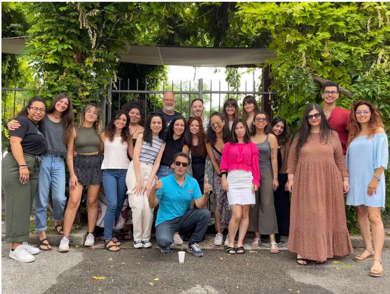
Младежките координатори/работници на проекта ReCAP – участници в Обучението на обучители във Виченца, Италия.